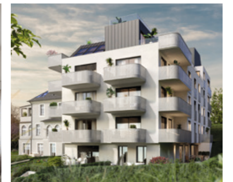
PROJEKT TWIN ESTATES | WIEN