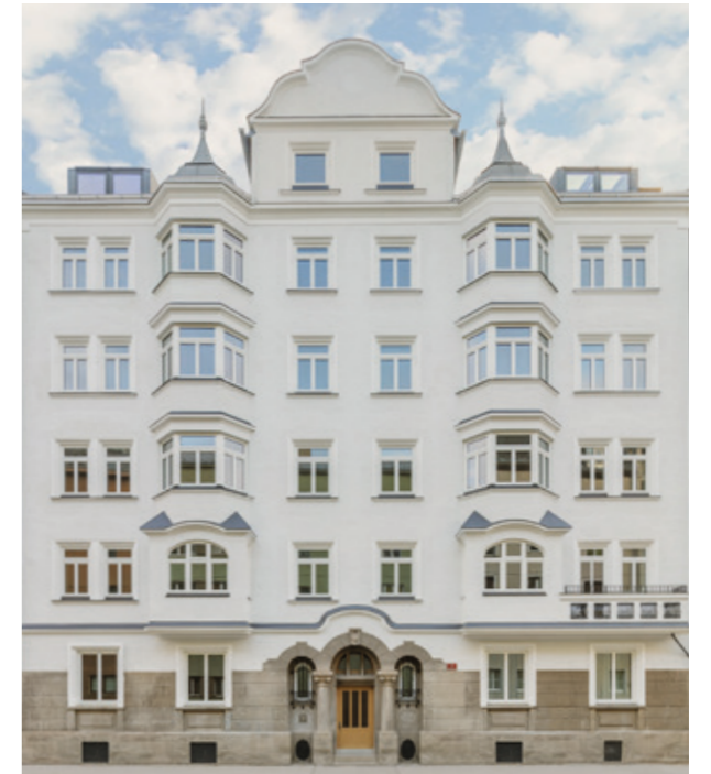
PROJEKT STADTPALAIS | INNSBRUCK

Innovative Wohnanlagen, komplexe Multifunktionsbauten, zukunftsweisende Großprojekte: Jedes Bauprojekt muss unseren hohen Qualitätsmaßstäben entsprechen. Das beginnt bereits bei der Auswahl des Grundstückes – Lage, Ausrichtung, Baudichte und Infrastruktur zählen dabei zu den Kernkriterien.